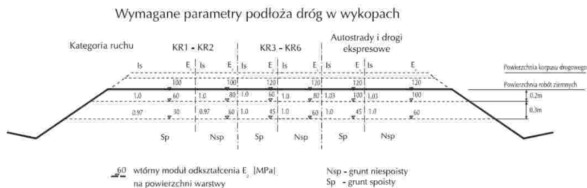
rys. nr 1